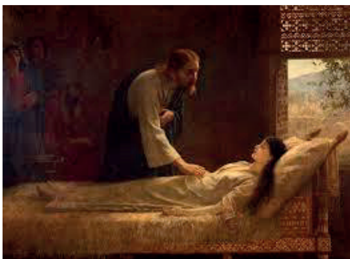
Jairus' daughter Edwin Long, Bath Museum

Sin dai tempi biblici, i bambini e i giovani hanno lodato Dio in mezzo a sfide e difficoltà e hanno visto la sua liberazione e i suoi miracoli. Ecco uno sketch basato sulla guarigione della figlia di lairo, che Gesù risuscitò dalla morte. È stato scritto da Tony ed Heather Houghton.